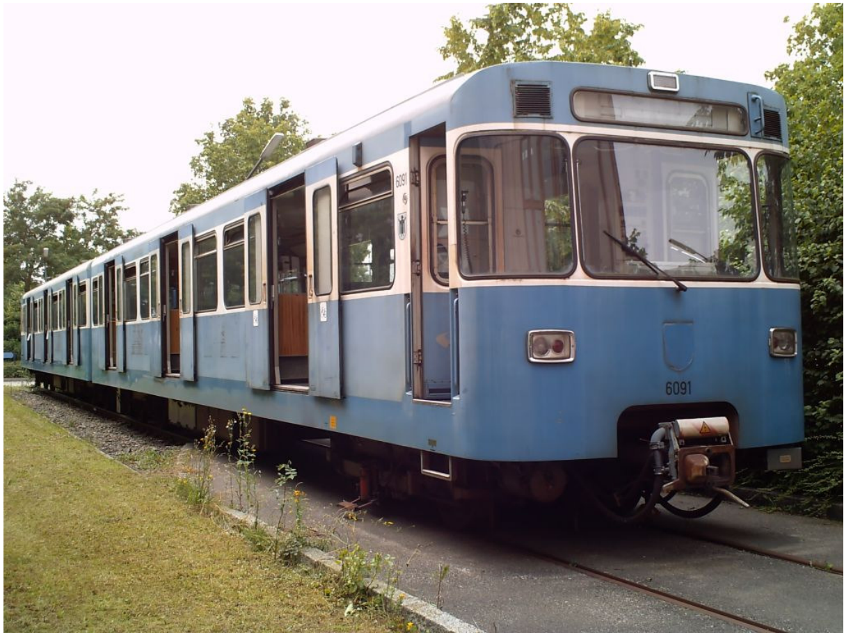
Frische Luft tut gut.

Hier also ein kleiner Situationsbericht von unserer Steffi. Zumindest sollte es uns von der MUF möglich sein ihm etwas Außenpflege zukommen zu lassen. Und wer weiß... Immerhin wäre der 19.10.2011 ein schöner Zeitpunkt ihn wieder im Blitzlichtgewitter der Fotografen leuchten zu lassen. (ah).