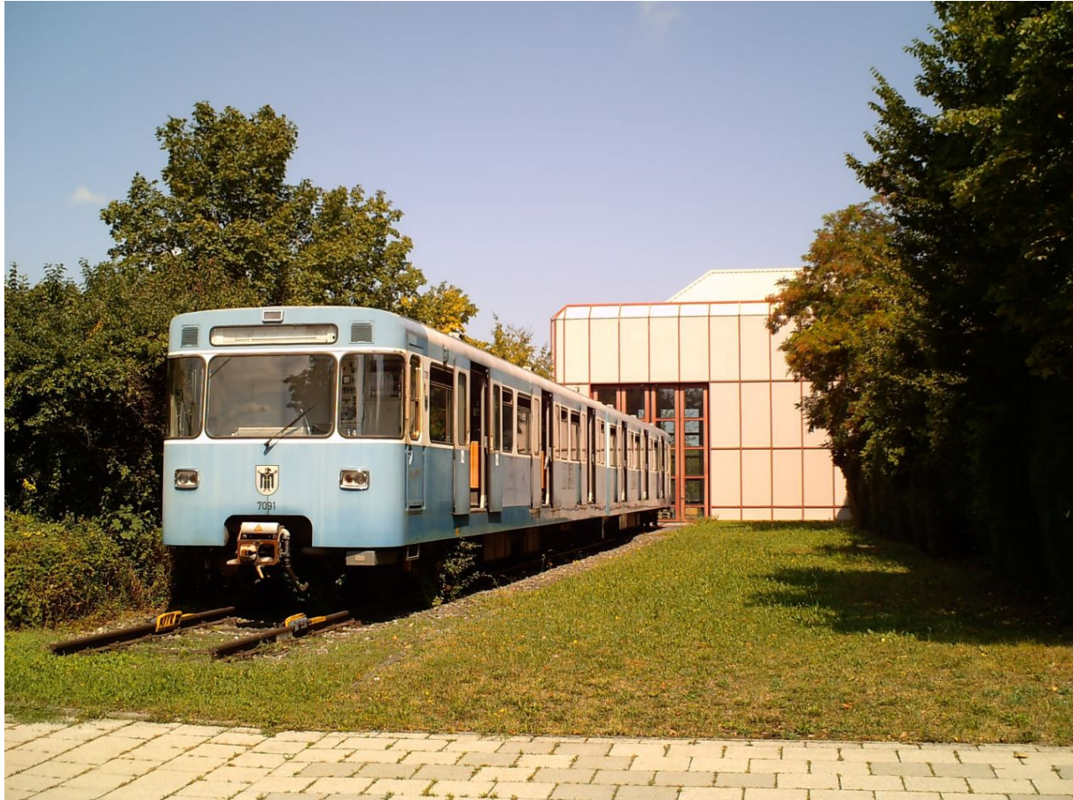
6091/7091 an seinem sonnigen Standort.

Hallo, ich bin der 091! Ich stehe derzeit im Betriebshof Nord neben dem Lager. Dort stehe ich eigentlich ganz gut, denn da hat meine Betreuerin einen nicht so weiten Weg zu mir. Seit dem Juni 2009 wird bei warmen und sonnigen Wetter mein Fahrgastraum gelüftet und getrocknet. Meine Fenstergummis sind nämlich nicht mehr die besten, stehe ich doch seit 2006 nur rum und habe nichts zu tun. Nun dringt bei starkem Regen ab und zu etwas Wasser in den Fahrgastraum. Darum hoffe ich derzeit auf eine Einhausung, damit es etwas trockener wird. Seit der Lüftungsaktion geht es mir schon viel besser. Und auch sonst ist mein Zustand gar nicht mal so schlecht... Also zumindest äußerlich. Naja, ein bisschen putzen und polieren könnte man mich mal und vielleicht bekomme ich ja auch mal neue Fenstergummis und Verkleidungen. Eventuell würde ich auch ganz gern mal wieder fahren, so richtig auf der Strecke. Da bin ich mir aber noch nicht sicher, ob ich mich wieder so anstrengen soll? Oder sich lieber herausgeputzt als Veteran der Münchner U-Bahn bewundern lassen? Das steht im Moment wahrscheinlich noch in den Sternen. Ich werde das alles Mal in Ruhe hier beobachten. (sg)